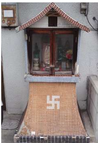
交通地蔵 2014年まで玉川3丁目 にあった

福島区では、八坂神社の宮座神事(大阪府無形文化財)、恵美須神社の十日えびすなどの伝統ある祭りのほか、夏祭りの地車巡行などが区民に季節の移り変わりを感じさせてくれます。