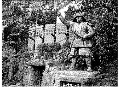
＜三光神社(大阪市天王寺区)に建つ幸村の銅像＞